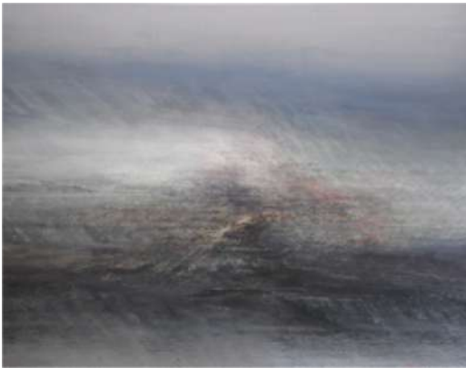
Aux confins – 2019 Acrylique marouflée sur toile - 146 x 114 cm © Mathieu Charles