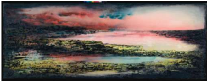
Endless Landscape – 2013 Techniques mixtes sur toile - 69 x 180 cm © Lionel Guibout