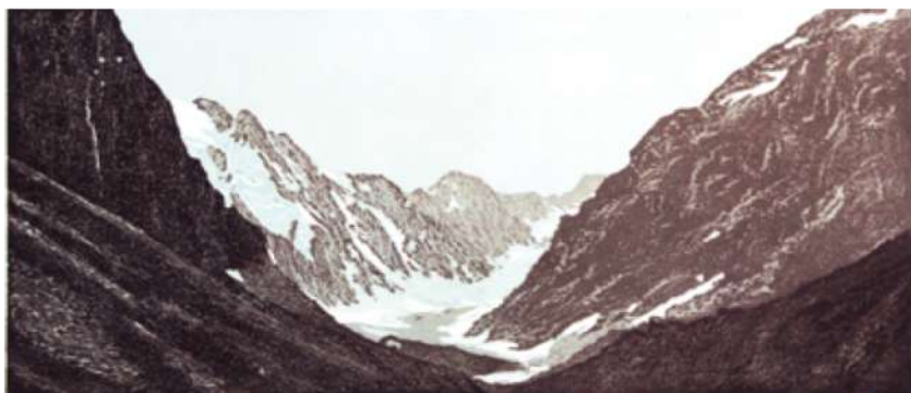
Vallée du Chardon – 2009 Xylogravure - 50 x 70 cm © Nicole Guézou

Après de nombreuses années consacrées à la peinture à l'huile, Nicole Guézou entre en gravure en 2004. Formée à la technique de la taille-douce dans les Ateliers des Beaux-Arts de la Ville de Paris, elle s'initie ensuite par elle-même au travail sur bois, et notamment sur bois perdu dont elle réinvente la technique.