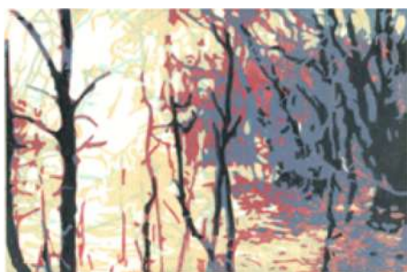
Sous-bois IV – 2016 Xylogravure – 30 x 20 cm © Jacques Meunier