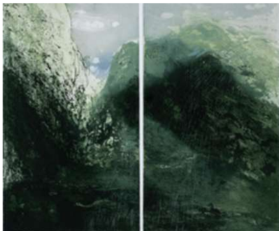
Ombre et lumière – 2016 Aquatinte - 50 x 60 cm