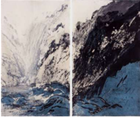
D'eau et de glace – 2016 Aquatinte - 50 x 60 cm © Ross Gash