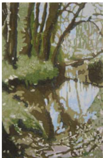
Forêt de Huelgoat II – 2014 Xylogravure - 40 x 30 cm © Nicole Guézou