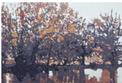
Automne sur le fleuve – 2019 Xylogravure - 40 x 50 cm © Nicole Guézou