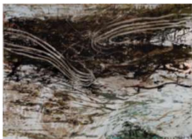
Lieu-dit La Fosse Marant – 2006 Huile sur toile - 200 x 280 cm © Alex Krassowski