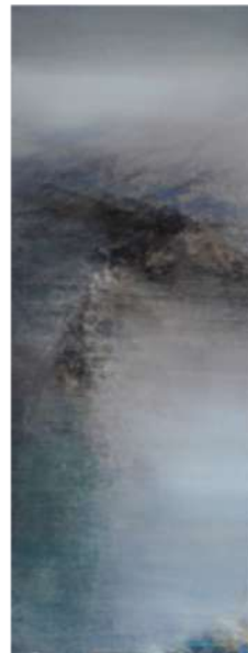
Cette lumière d'avant le langage – 2017 Acrylique marouflée sur toile - 155 x 60 cm (par panneau) © Mathieu Charles