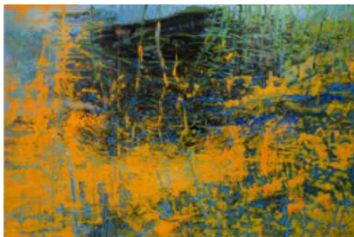
Série palimpseste – 2019 Huile sur toile - 195 x 295 cm © Christine Jean