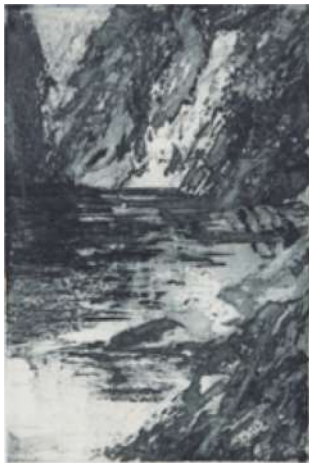
Les eaux calmes – 2016 Aquatinte - 50 x 40 cm © Ross Gash