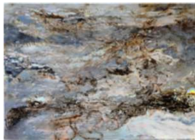
Lieu-dit Les Mouvances – 2006 Huile sur toile - 200 x 280 cm © Alex Krassowski