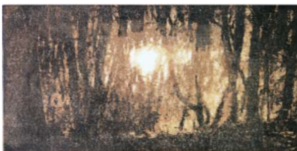
Coucher de soleil I – 2017 Xylogravure – 60 x 30 cm © Jacques Meunier