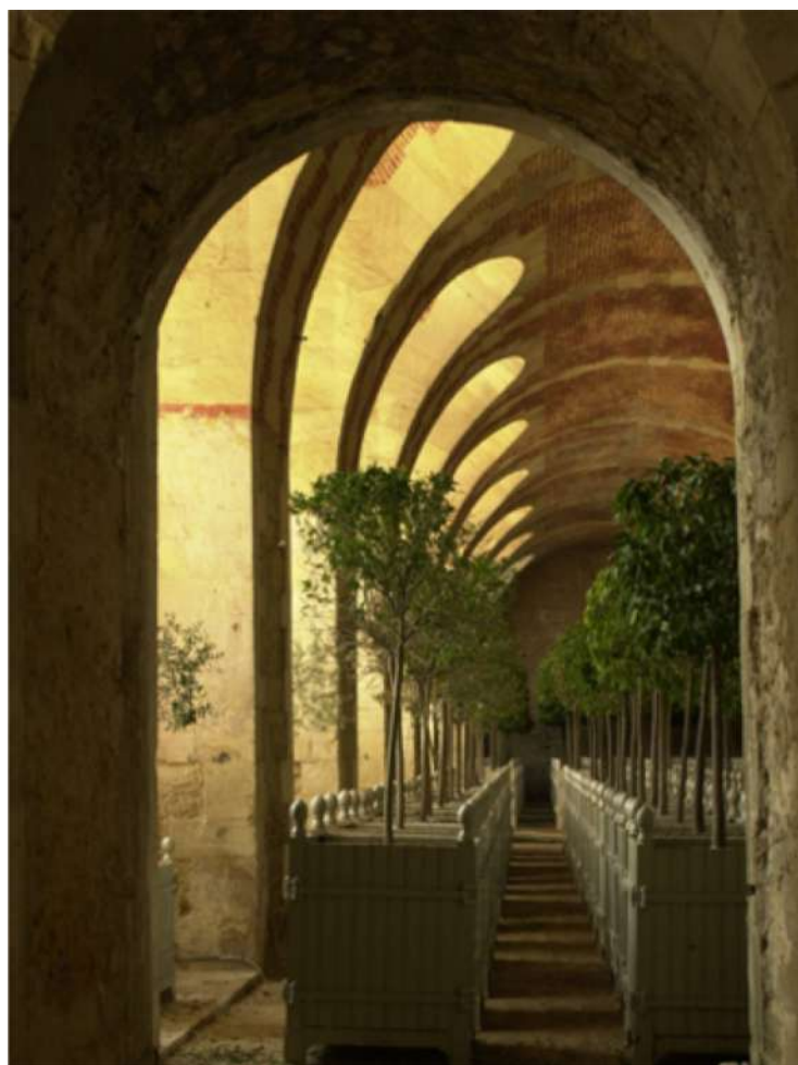
Vue de l'intérieur de l'Orangerie

Cette exposition bénéficie du soutien de la Ville de Meudon et du Musée d'Art et d'Histoire de Meudon.