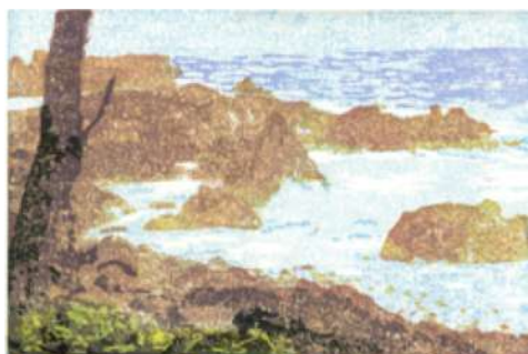
Crique sauvage – 2018 Xylogravure – 30 x 20 cm © Jacques Meunier

Après des études de physique à l'École Normale Supérieure, Jacques Meunier est devenu chercheur au CNRS. Originaire d'un milieu familial tourné vers l'art et la nature, il a toujours exercé en parallèle une activité artistique. Ce fut d'abord la peinture à l'huile et le dessin avec une formation aux Ateliers des Beaux-Arts de la ville de Paris, avant de se tourner vers l'estampe et l'aquarelle.