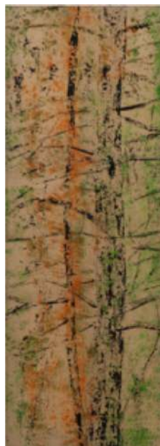
Forêt d'automne - 2009 Techniques mixtes sur toile - 223 x 83 cm © Lionel Guibout

Peintre, graveur, pastelliste et sculpteur, Lionel Guibout est de ces artistes polyvalents qui font de leur art un mélange insolite d'effervescence, de luxuriance et de poésie.