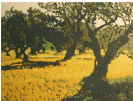
Oliviers – 2018 Xylogravure - 40 x 50 cm © Nicole Guézou