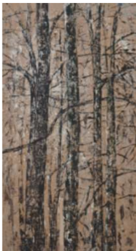
Rideau d'hiver - 2009 Techniques mixtes sur toile - 233 x 123 cm © Lionel Guibout