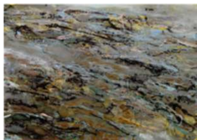
Lieu-dit Sous les marées – 2006 Huile sur toile - 200 x 280 cm © Alex Krassowski