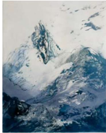
Écoute du silence – 2018 Aquatinte - 70 x 50 cm © Ross Gash