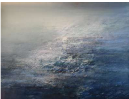
Rivage 3 – 2016 Acrylique marouflée sur toile - 160 x 120 cm © Mathieu Charles

Peintre autodidacte né sur une presqu'île de falaises dans une famille de gens de mer, Jean-Luc Bourel appartient à ces rares artistes discrets que l'on se réjouit d'avoir rencontrés.