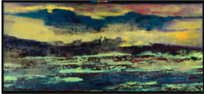
Endless Landscape – 2013 Techniques mixtes sur toile - 80 x 180 cm © Lionel Guibout