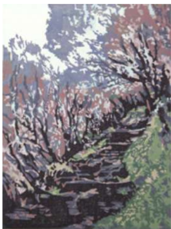
Montée au Piton des Neiges – 2016 Xylogravure - 70 x 50 cm © Nicole Guézou