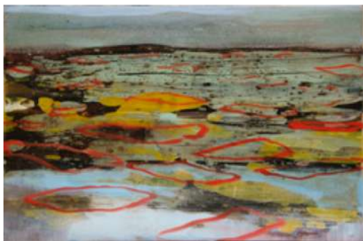
Série Paysage sans titre – 2017 Huile sur bois - 23 x 34,5 cm © Christine Jean

Formée à l'École des Beaux-Arts du Havre, Christine Jean éprouve ses premières émotions esthétiques dans cette ville moderne et minérale, reconstruite sur les ruines des bombardements de 1944, face à l'océan. Elle est alors saisie par le contraste des coexistences : celle du matériau brut et de l'élément naturel, celle de l'angle droit et de la mouvance, celle de la souffrance et de la beauté.