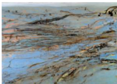
Lieu-dit Le Long Rideau – 2006 Huile sur toile - 200 x 280 cm © Alex Krassowski