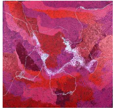
Jorna Newberry (née en 1959) My Grandfather's country (2020) Acrylique sur toile – 120 cm x 118 cm