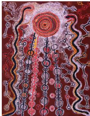
Witjiti George (c.1938) Sans titre (2019) Acrylique sur toile – 153 cm x 102 cm