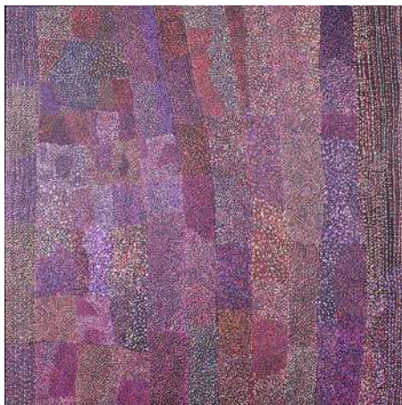
Patsy Marfura (née en 1942) Durrmu (2007) Acrylique sur toile – 110 cm x 110 cm