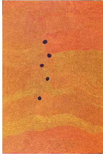
Imelda Gugaman Yukenbarri (née en 1954) Winpurpurla (2012) Acrylique sur toile – 180 cm x 120 cm