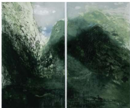
Ombre et lumière – 2016 Aquatinte - 50 x 60 cm © Ross Gash

Formée à l'École Régionale des Beaux-Arts de Valence de 1968 à 1973, Hélène Baumel s'oriente rapidement vers la gravure dans l'atelier de Jacques Clerc. Elle y apprend à maîtriser diverses techniques (taille douce, aquatinte, taille d'épargne, bois et linoléum) et révèle ses aptitudes pour le dessin et la couleur.