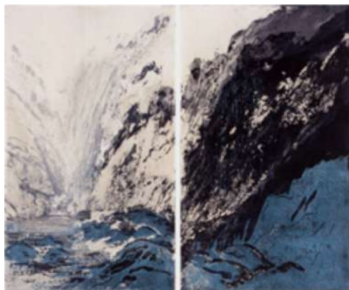
D'eau et de glace – 2016 Aquatinte - 50 x 60 cm © Ross Gash