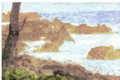
Crique sauvage – 2018 Xylogravure – 30 x 20 cm © Jacques Meunier

Après des études de physique à l'École Normale Supérieure, Jacques Meunier est devenu chercheur au CNRS. Originaire d'un milieu familial tourné vers l'art et la nature, il a toujours exercé en parallèle une activité artistique. Ce fut d'abord la peinture à l'huile et le dessin avec une formation aux Ateliers des Beaux-Arts de la ville de Paris, avant de se tourner vers l'estampe et l'aquarelle.